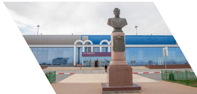
Международный аэропорт Махачкала (Уйташ) имени дважды Героя Советского Союза Амет-Хана Султана